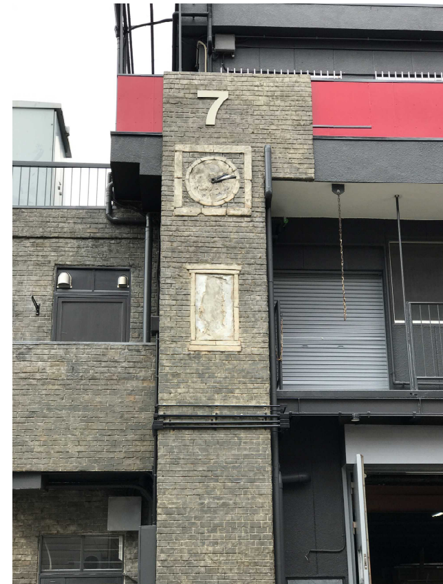
施工後【モルタル造形+エイジングペイント】 外壁塗装 屋上防水