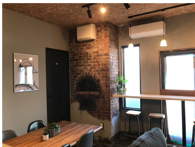
ピザ店風内装 レンガやピザ釜は造形モルタル