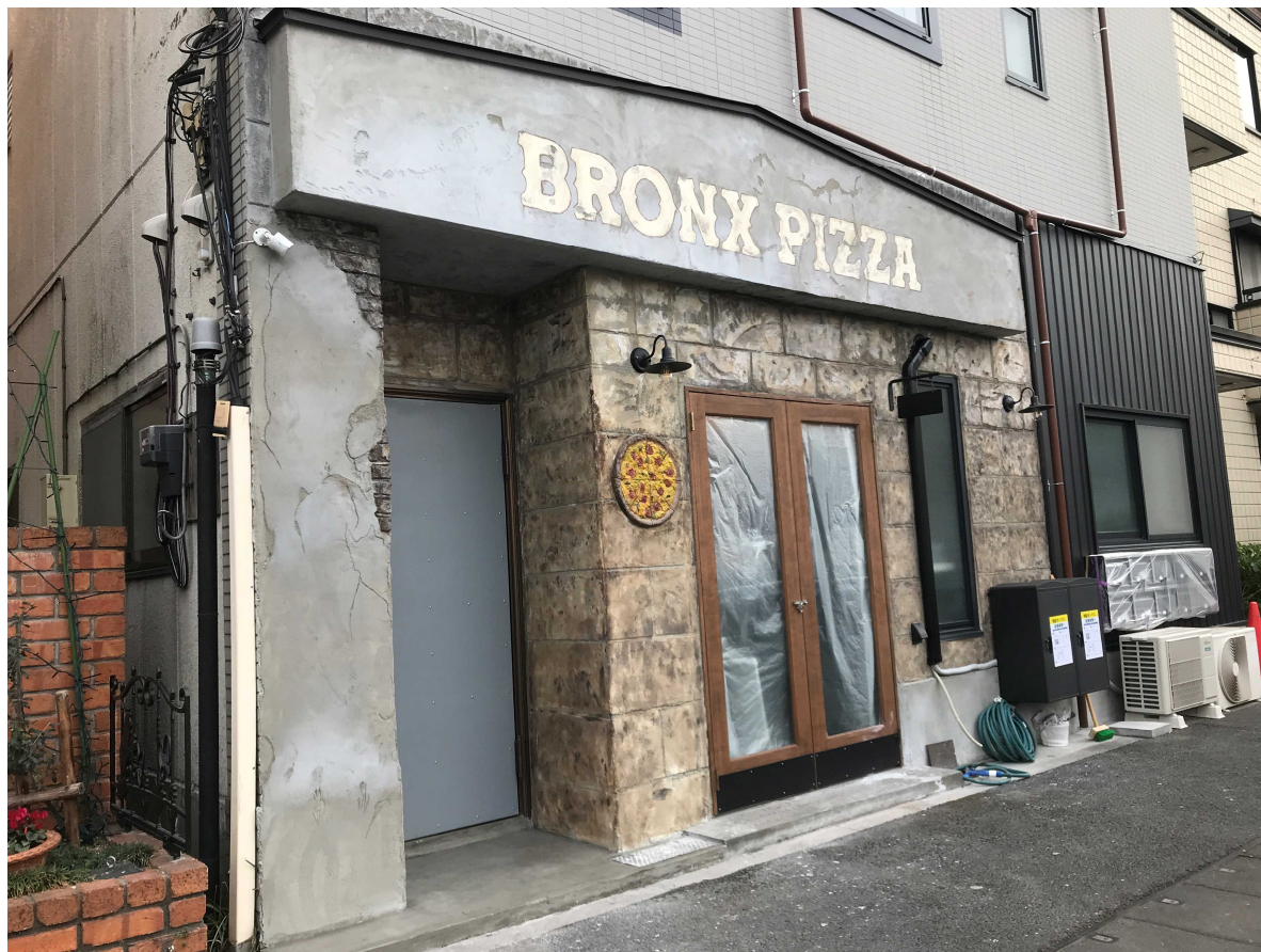
施工後【モルタル造形+エイジングペイント】 外壁塗装は幹線道路面