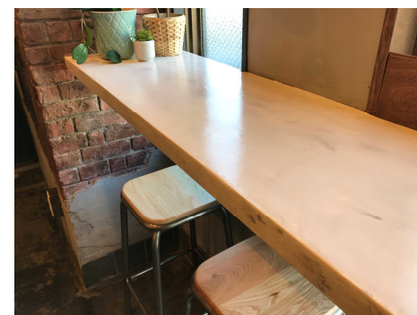
カウンター 石目調MPC塗装